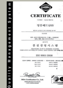
ISO9001 : 2008