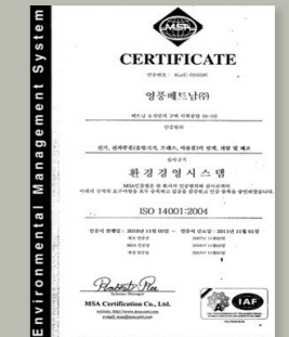
ISO14001 : 2004